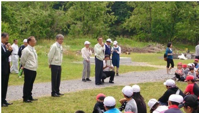
鹿沼市長佐藤信様