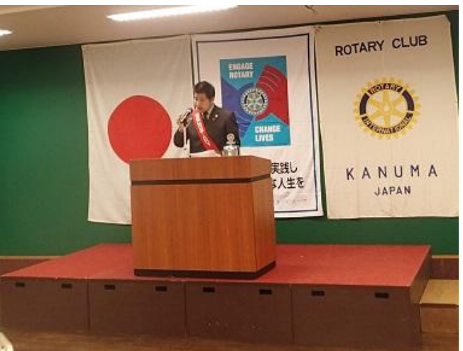
1. 第 7 回理事会報告