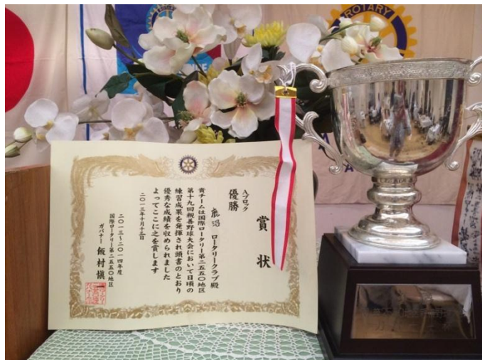
第 2550 地区第 19 回親善野球大会にて優勝。 1 回戦鹿沼 4-3 宇都宮西 2 回戦鹿沼 25-5 宇都宮陽東

決勝戦鹿沼 12-0 宇都宮陽北。来月 15 日から 3 日間全国選抜大会 応援よろしくお願ひします。